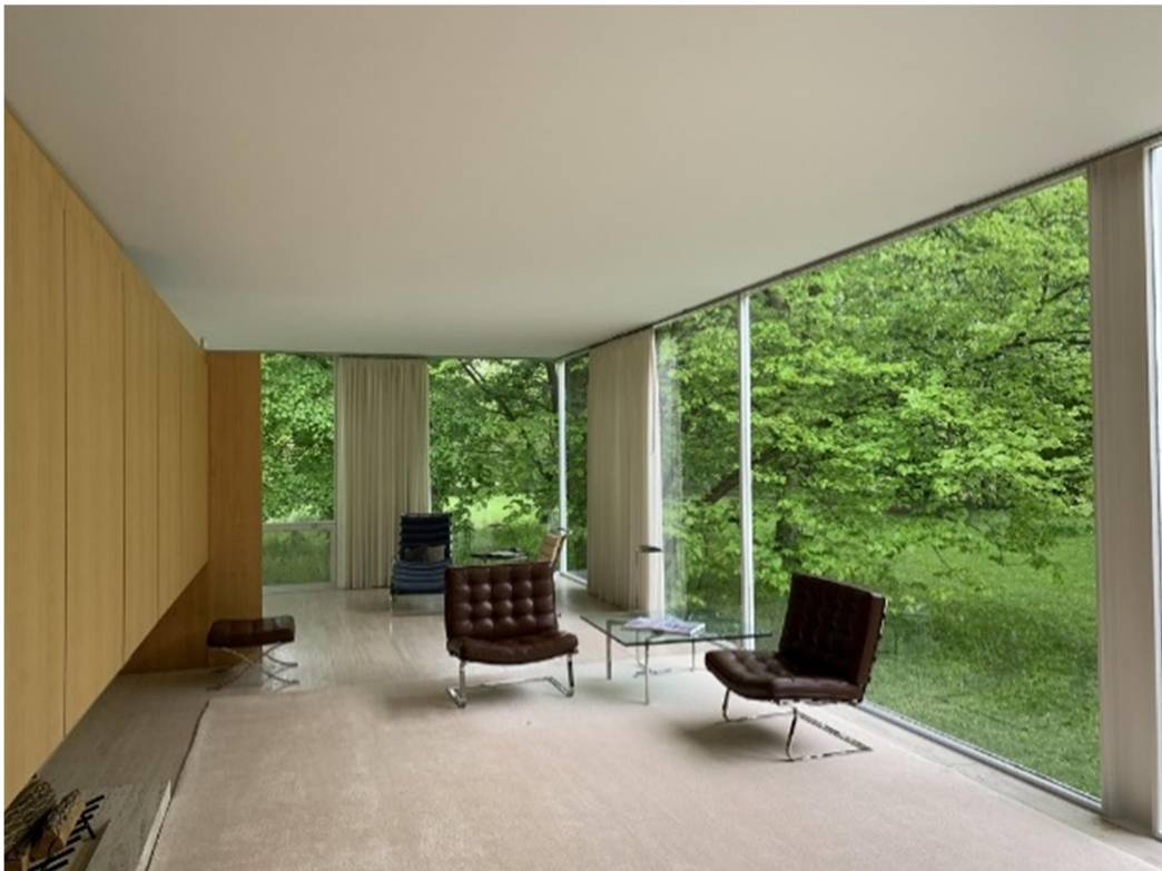
Imagem 02. Casa Farnsworth