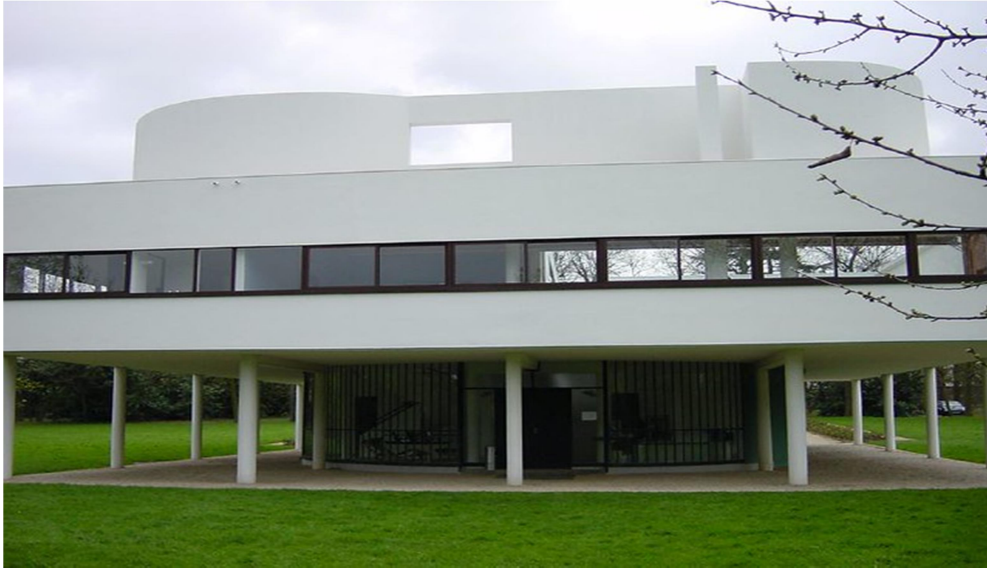
Imagem 03. Villa Savoye- Le Corbusier