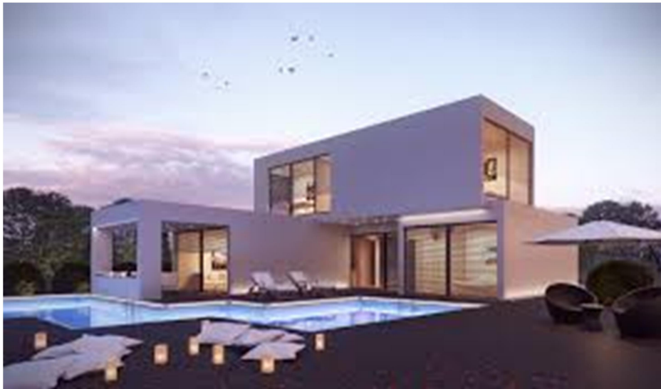
Imagem 04. Fachada minimalista